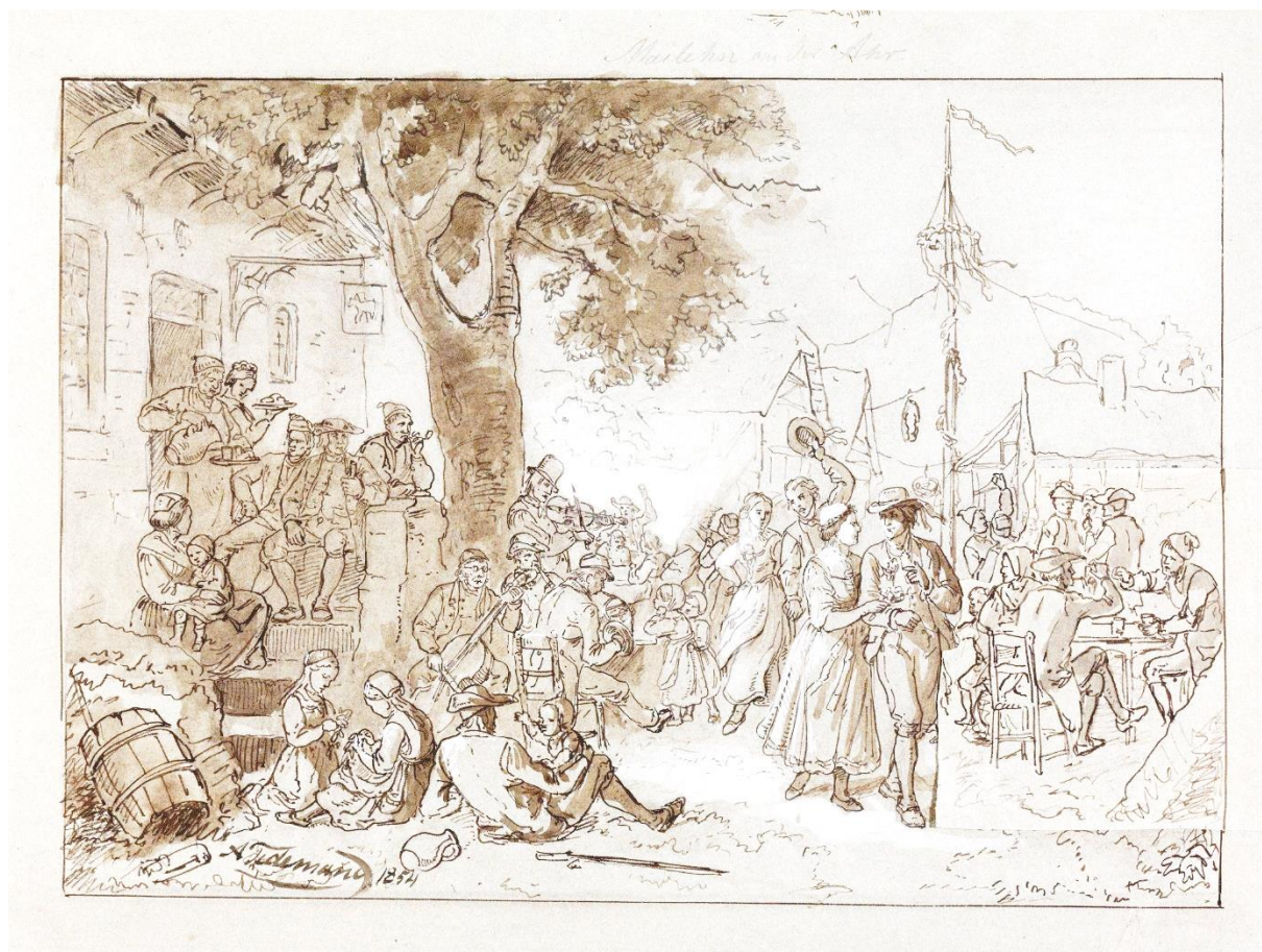
TECKNING FRÅN 1854 AV DEN NORSKE KONSTNÄREN ADOLPH TIDEMANN (1814-1876). BILD FRÅN NASJONALMUSEET.