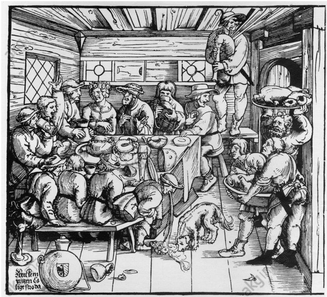
BONDEBRÖLLOP PÅ EN KROG 1527, TRÄSNITT AV ERHARD SCHÖN (1491-1542).