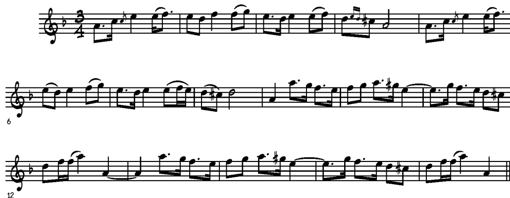
BILD: LÅT EFTER JOSEFS LARS OLSSON. UPPECKN. I SÄCKPIPAN I NORDEN, S. 450. NOTBILD AV J. TIDERMAN-ÖSTERBERG. LÅTEN FÖREKOMMER, PRECIS SOM ALL ANNAN MUSIK, I MÅNGA VARIANTER.